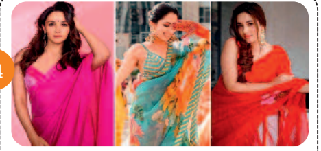
साड़ी के लेटेस्ट फैशन ट्रेंड अपनी...